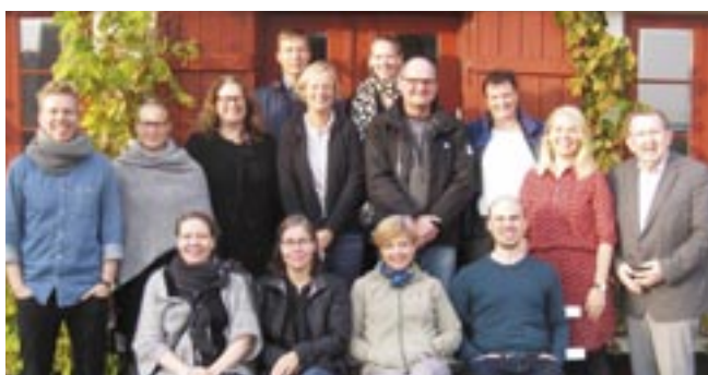
Faciliteterne til Modul 2 på Samsø. Se www.kobmandsgarden.dk